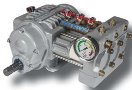
Bomba super directa ML-A (Equipamiento de serie)

Gracias a su diseño compacto y de reducida altura, es posible maniobrar con facilidad en parcelas de cultivos en emparrados.