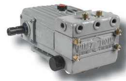
Bomba especial directa ML-D

Su especial diseño y orientación de los difusores Twister, hacen de este atomizador una herramienta específica y profesional para los diferentes cultivos en emparrado.