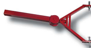
Lanza articulada a los brazos del tractor