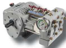
Bomba super reductora ML-A1

Ocho difusores Twister con 24 portaboquillas antigota con boquillas de turbulencia que garantizan un tratamiento homogéneo y eficaz.